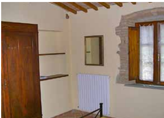
Soveværelset ligger i forlængelse af køkken/stue/alrummet - det er lyst og rummeligt