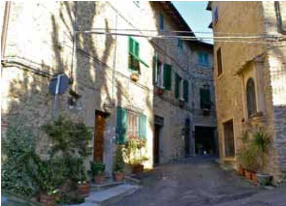
Byen er hyggelig med små gader og charmerende huse - Chianni er en by med sjæl