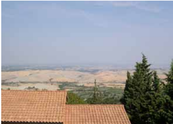
Fra lejligheden er der vid udsigt over det toscanske landskab med marker osv.