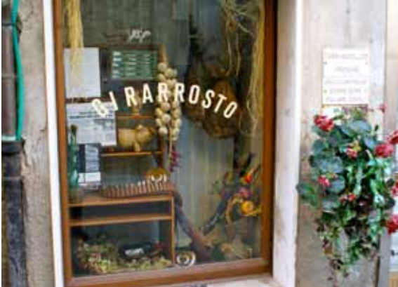
Chianni by har gode indkøbsmuligheder - alt fra dagligvarer til specialbutikker