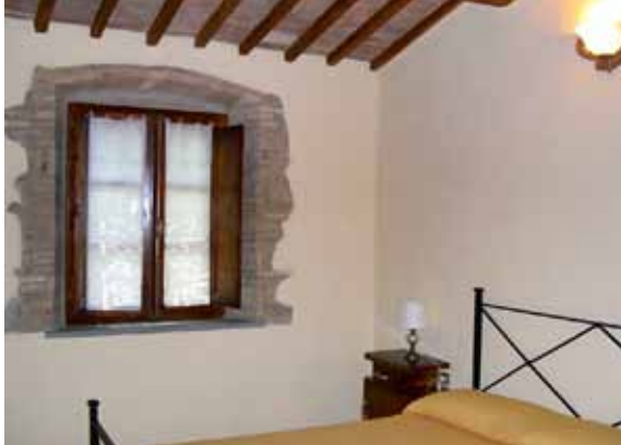
Det sydvest vendte soveværelse har et smukt vinduesparti og flot bjælkeloft