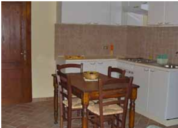
På typisk toscansk vis er køkkenet placeret i stuen, som udgør hjertet i hjemmet