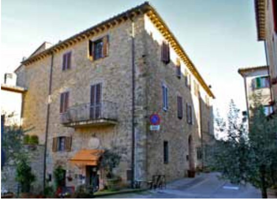
Her er mange smukke stenhuse, der er flot restaureret med respekt for historien