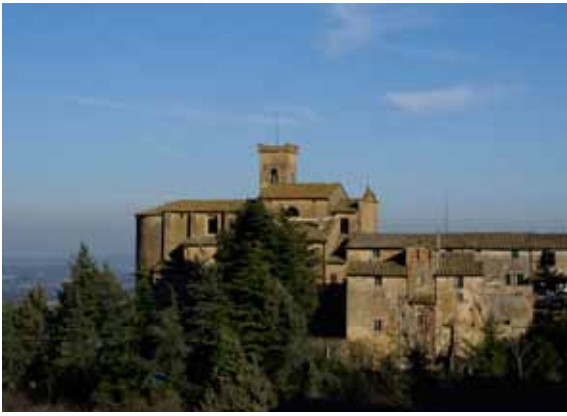
Chianni er en antik borgby fra middelalderen - en aktiv by, der ikke er 'turistet'