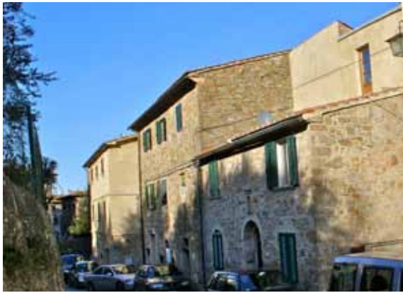
Lejligheden ligger på 1. sal (øverst) i den lille hyggelig ejendom